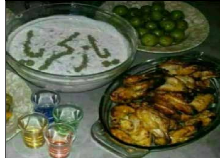
۵ شهریور سالروز تولد یگانه منجی عالممستی اختر تابناک عیش و نوش و عشق و حال "محمد بن زکریای رازی" کاشف مظلوم الککل بر همه الککل دوستان ۴۳% به بالا مبارکباد دلت شاد چشمانت قرمز سرت داغ و صدایت دورگه یاد