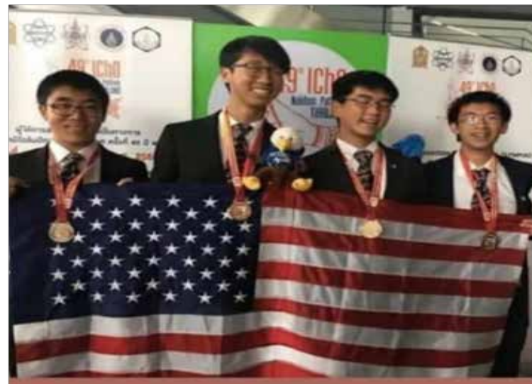
تیم آمریکا موفق شد برای اولین بار در ۳۰ سال اخیر تیم چین را در مسابقات ریاضی شکست دهد! تصویر تیم آمریکا رو مشاهده میکنید

دویس تومن ارز دیجیتال خریدم صبح به صبح مثل نیویورکیا می شینم قهوه می خورم نمودار نگاه می کنم *****